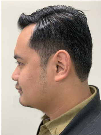
Tepi: Tidak melebihi telinga