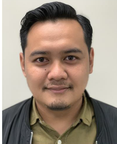
Depan: Tidak menutupi dahi